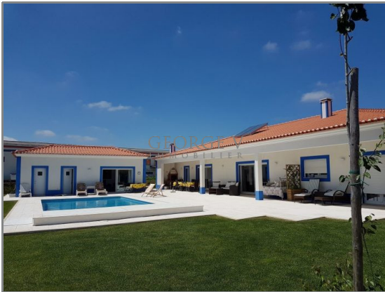
Coup de cœur